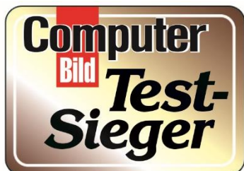
HEFT 7/2017: GUT